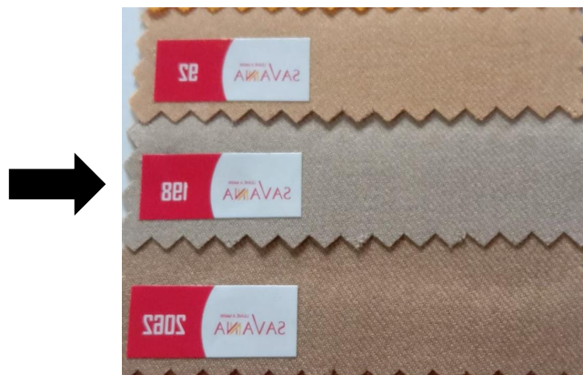
Gambar 3. Contoh Kain Jas Profesi

Ditetapkan di : Jakarta Pada tanggal : 01 Februari 2023